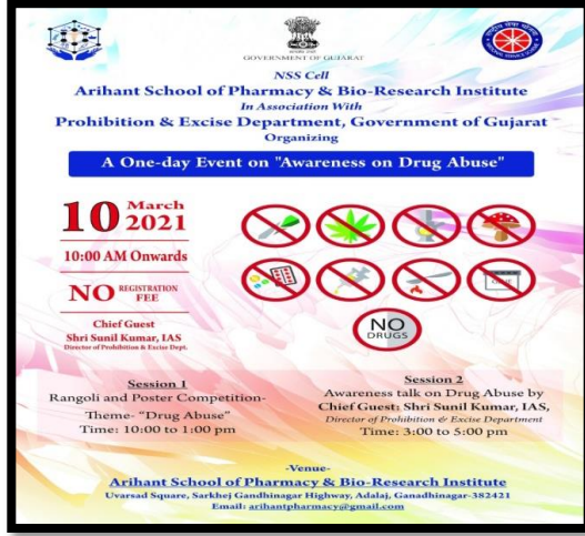
Flyer of session