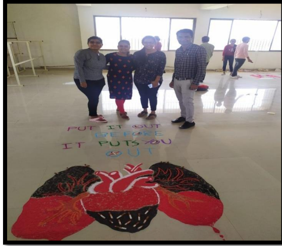
Theme of Rangoli